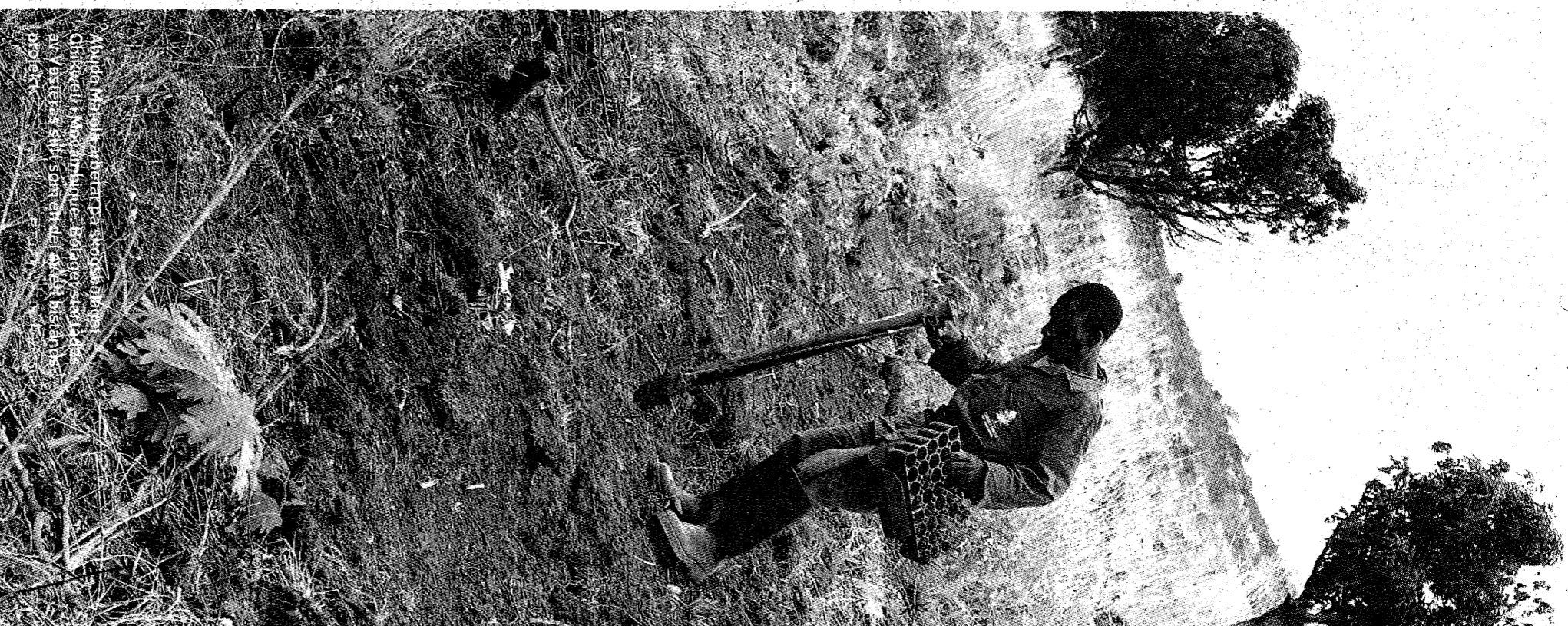
Flydda ut som arbetare på skogsbyggen i Moçambique. Bild tagen av Jenny Petersson för DN. Bilderna är avsett att sändas i DN:s bildbyrå.

JENNY PETERSSON jenny.petersson@dn.se 08-738 15 18